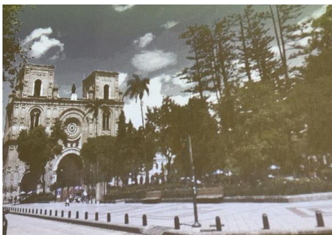
町の中心の大聖堂