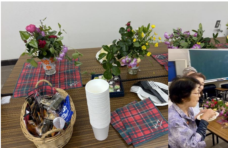
茶話会の準備も万端 沢山お花も華やか